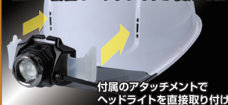
付属のアタッチメントで ヘッドライトを直接取り付け