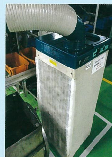
スポットクーラーへの A5075 取付例

●正方形エアウォッシュフィルター A タイプ 対象機器：業務用エアコン、その他空調機器