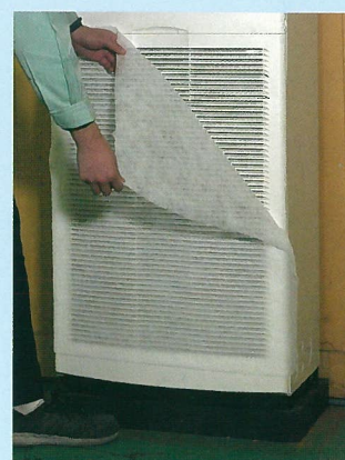
工場エアコンへの A800 取付例