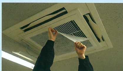
天井エアコンへの A600 取付例